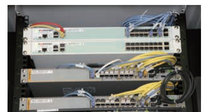
センター病院のサーバーラームに設置されたFortiGate

無線AP(アクセスポイント)を制御できる製品を中心に検討を開始。医療関係の展示会に出展されていたフォーティネットのワイヤレスソリューションの説明を聞いて「双星会の要件に最適」と納得したという。