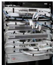
サーバーラームに設置されたFortiGate、FortiSwitch、FortiAnalyzer

BYODで学生が私物のデバイスを持ち込むことも可能だが、その場合はWeb認証を経てから利用する。古いマシンがあったり、